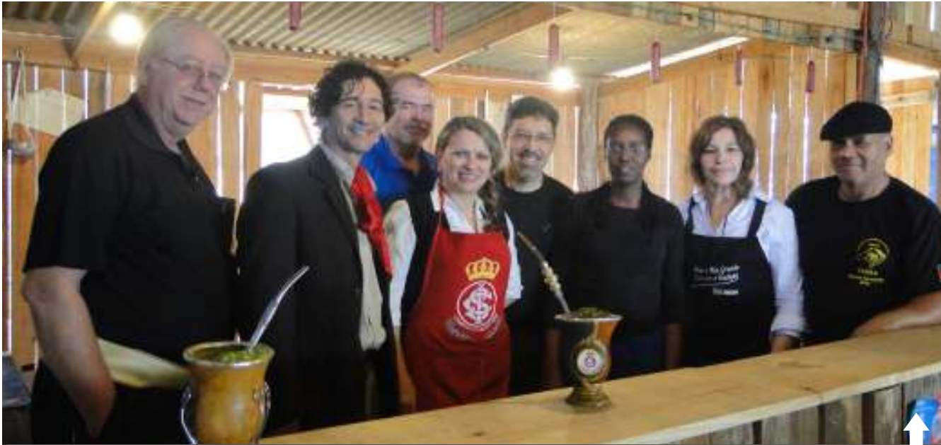
Equipe do Piquete: trabalho dobrado durante quase um mês