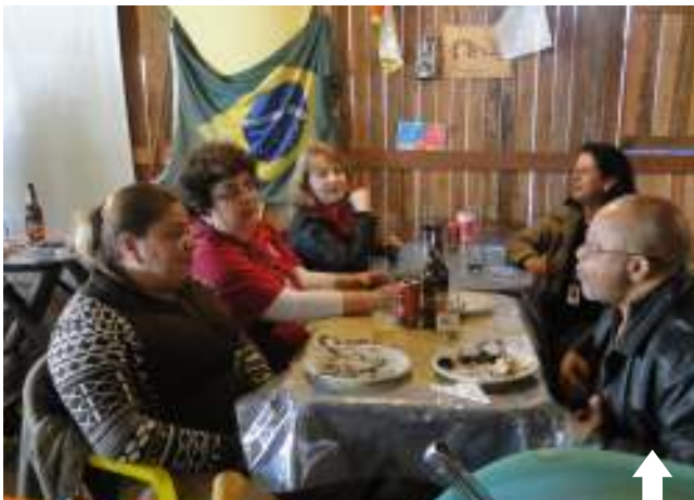
Piquete do Serpro: confraternização

Todo ano, cerca de dez empregados e empregadas se revezam para coordenar a manutenção do Piquete Taura, de responsabilidade do Serpro. Além dos tradicionalistas, muitas entidades marcam presença no evento: grandes empresas, públicas e privadas, organizações não governamentais, representações políticas, totalizando cerca de 400 piquetes montados no