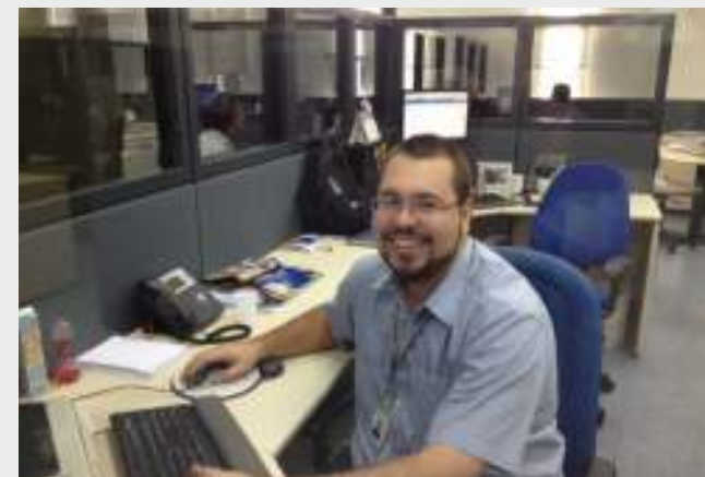
■ Belo Horizonte Vocação em família

O analista/professor reconhece que exercer, ao mesmo tempo, os dois papéis traz desafios. Mas as situações ruins devem ser encaradas com jogo de cintura. “Sempre tem um aluno querendo testar a sua paciência. Tem que saber lidar, tentar trazer essa pessoa para o seu lado. Com um elogio e um pouco de atenção, é possível contornar esse tipo de situação”, aconselha.