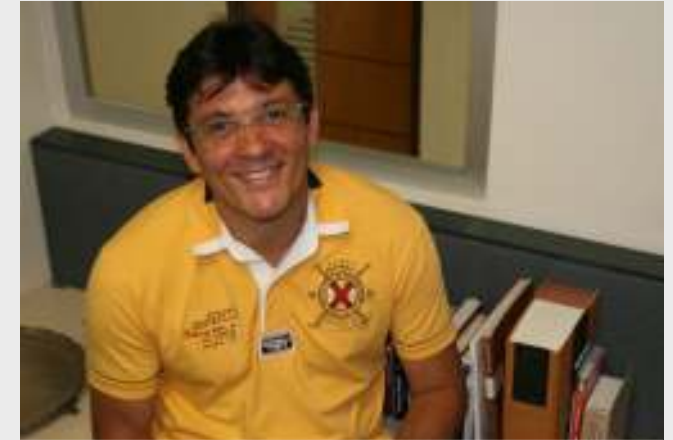
■ Recife Vocação e dedicação

Da experiência de lecionar, ele lembra um caso corriqueiro. Recentemente, um aluno de gerenciamento de projetos lhe pediu uma “questão bomba”, daquelas que ninguém acerta, para aplicar em uma equipe de jogos empresariais. No dia seguinte, o aluno chegou rindo, contando sobre a polêmica questão. Foi um exemplo de suas cotidianas satisfações. “Acredito que para a maioria de nós, professores, as grandes recompensas são essas: ver as pessoas se transformarem em melhores cidadãos, crescerem, tornarem-se felizes”, resume Roges.