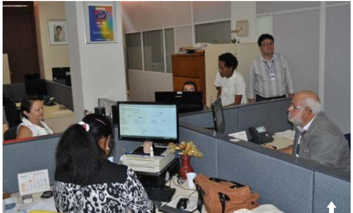
Aberto em 1987, escritório na Fazenda abriga nove empregados

O escritório atua principalmente na prestação de serviços de administração de rede local para os clientes Receita Federal do Brasil (RFB), Secretaria de Patrimônio da União (SPU), Procuradoria da Fazenda Nacional (PFN), Departamento de Polícia Federal (DPF) e Departamento Nacional de Infraestrutura Terrestre (Dnit), administrando 511 estações de trabalho e 58 servidores de rede. As atividades de suporte são, na maioria, relacionadas à instalação e resolução de problemas de software, além de ações de configuração, atendimento a